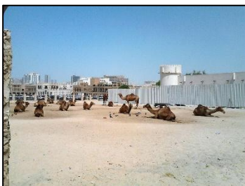
カタールの首都「ドーハ」